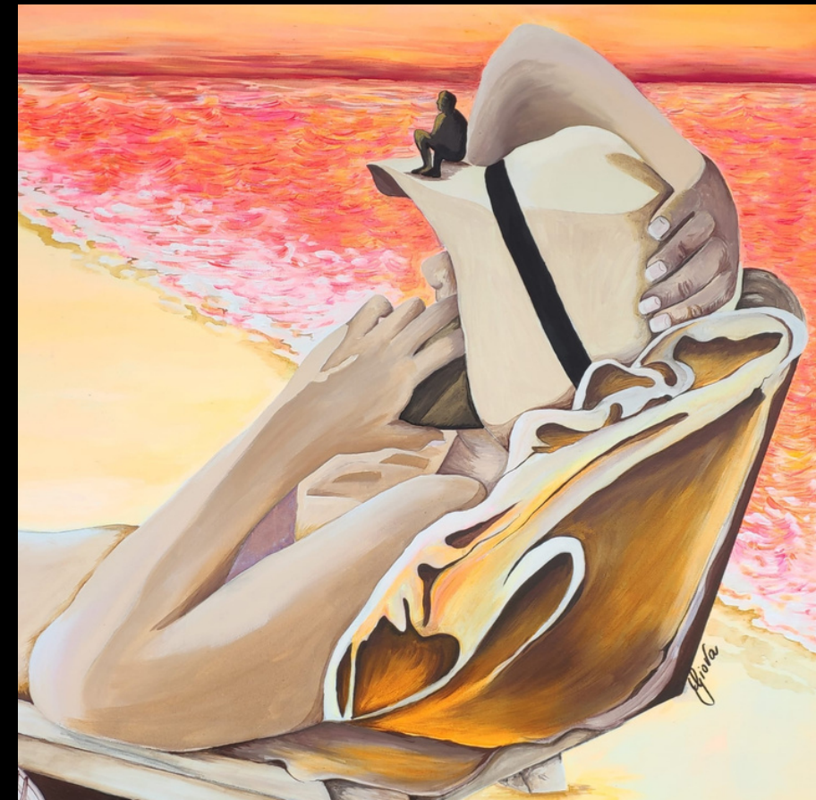
02 Domani (2020) acrilico su tela 80x80

Il sogno è una realtà forte che nel tempo si opacizza. Nasce e si rafforza nell'infanzia e riemerge con la sua espressività nell'artista, che ne fa un valore da vivere e rivivere. Nella dolcezza del bianco e del color lavanda, volano le persone, sorrette dai morbidi soffioni. Alla ripresa del sogno.