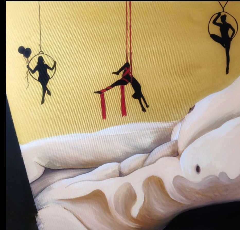
08 Seduzioni 1 (2020) sopra Seduzioni 2 (2020) in copertina acrilico su tela - tecnica mista 70x80

La cravatta ha la misura della compostezza di un collo maschile, scende geometrica sotto il pomo d'Adamo e la barba rada. Simbolo di uno stile, affianca la mascolinità. Dalle persone, da chi guarda, pretende una reazione.