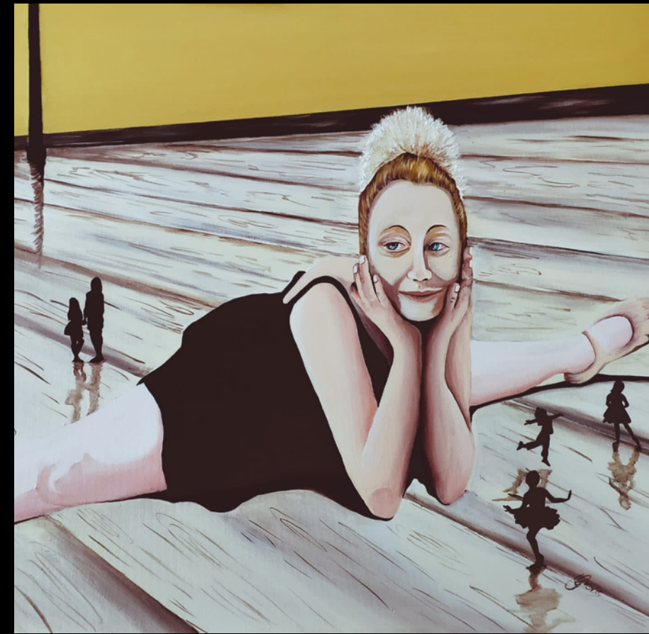
06 A Greta (2020) acrilico su tela 70x100

Le terre in fiore di Norcia, fotografia di colore e sofferenza, qui si trasformano nella visiera, nell'immagine fissa di fronte agli occhi. L'osservazione è una vera e propria variazione della realtà visiva e mentale. Ad ognuno il proprio modo di guardare, purché ostacoli ogni forma di cecità.