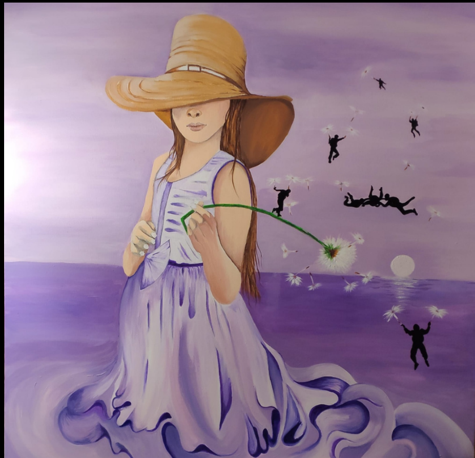
01 Distributrice di sogni (2020) acrilico su tela 80x80

Il sogno è una realtà forte che nel tempo si opacizza. Nasce e si rafforza nell'infanzia e riemerge con la sua espressività nell'artista, che ne fa un valore da vivere e rivivere. Nella dolcezza del bianco e del color lavanda, volano le persone, sorrette dai morbidi soffioni. Alla ripresa del sogno.