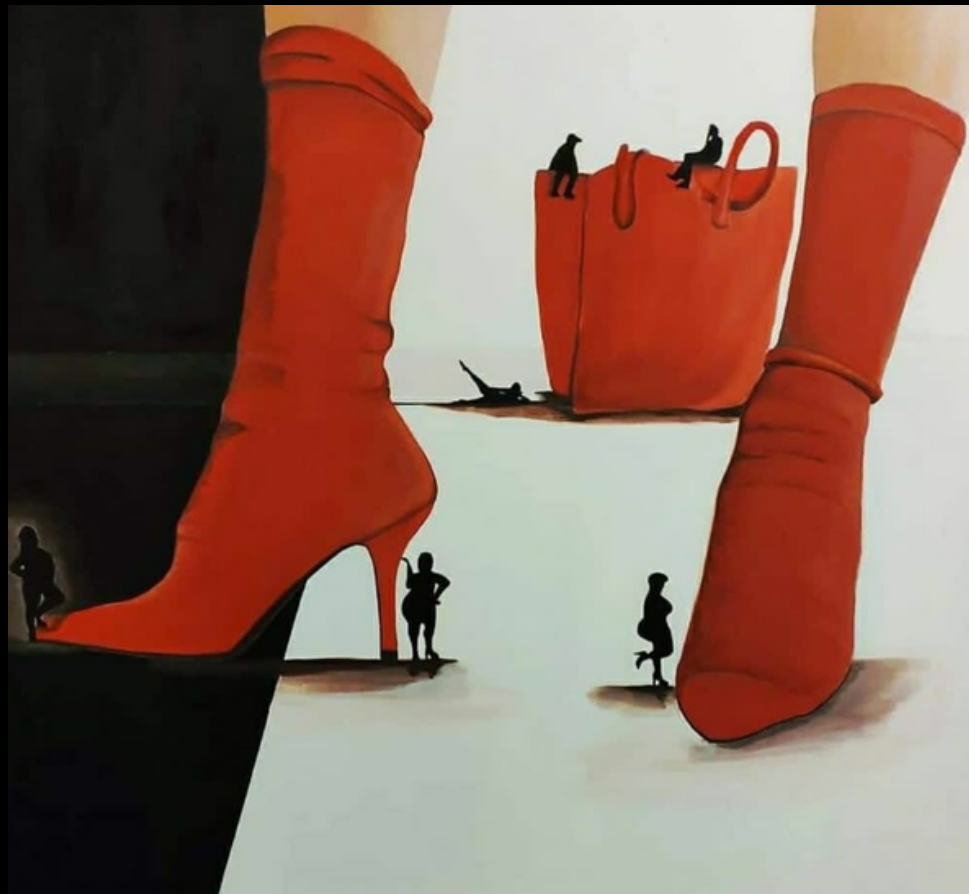
03 Autoritratto (2019) acrilico su tela 20x40

Mostrarsi e caratterizzarsi in un colore. Dimostrarsi e rappresentarsi con le forme di un accessorio. Tacco e rosso. Tessuto e punta. Lo sguardo degli altri sulla propria naturalezza, bella e incompresa.