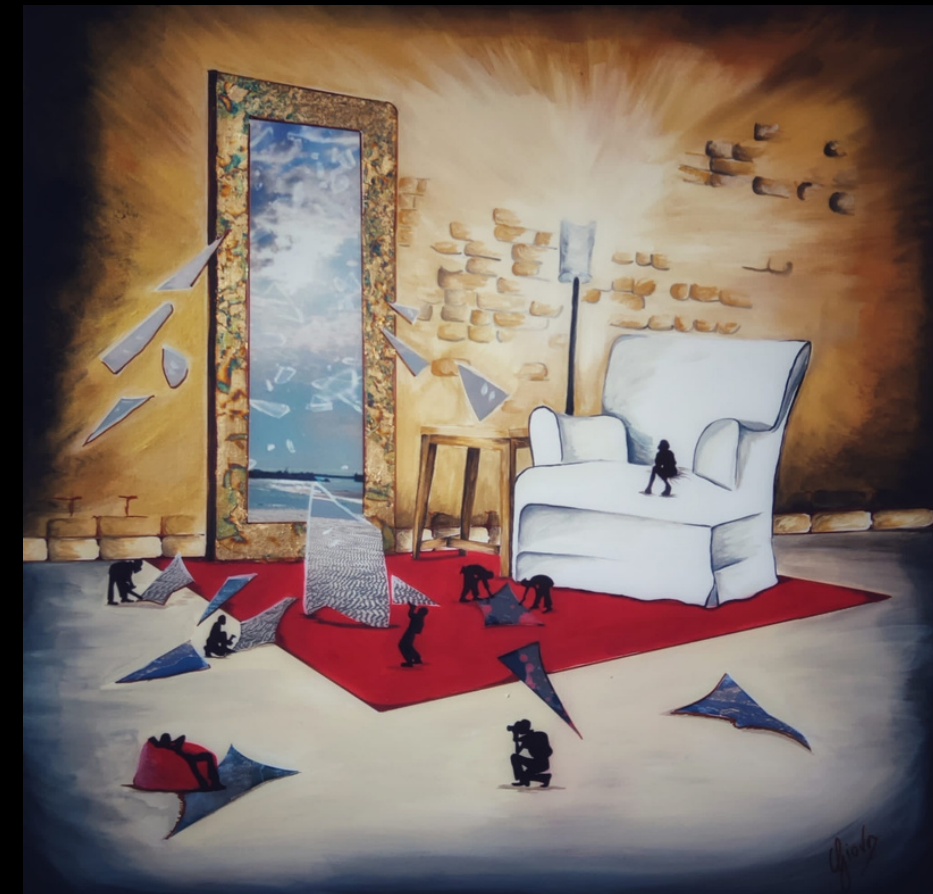
04 Equilibri spezzati (2020) acrilico su tela 80x80

Mostrarsi e caratterizzarsi in un colore. Dimostrarsi e rappresentarsi con le forme di un accessorio. Tacco e rosso. Tessuto e punta. Lo sguardo degli altri sulla propria naturalezza, bella e incompresa.