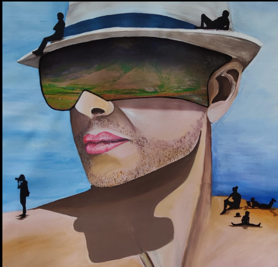
05 Contemplazioni (2020) acrilico su tela 60x90

Le terre in fiore di Norcia, fotografia di colore e sofferenza, qui si trasformano nella visiera, nell'immagine fissa di fronte agli occhi. L'osservazione è una vera e propria variazione della realtà visiva e mentale. Ad ognuno il proprio modo di guardare, purché ostacoli ogni forma di cecità.