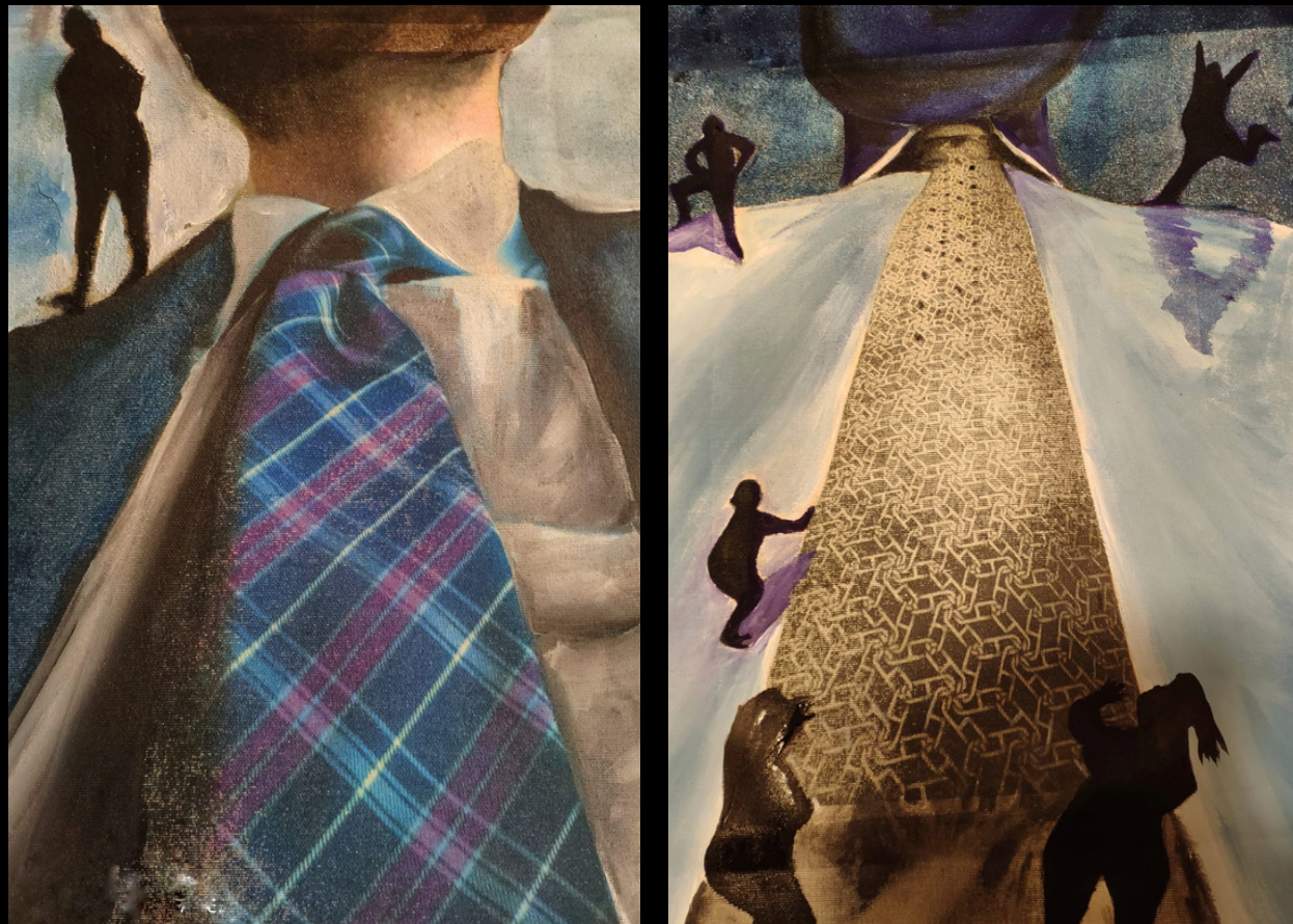
07 Come un uomo 1 (2019) a sinistra Come un uomo 2 (2019) a destra acrilico su tela 20x40

La cravatta ha la misura della compostezza di un collo maschile, scende geometrica sotto il pomo d'Adamo e la barba rada. Simbolo di uno stile, affianca la mascolinità. Dalle persone, da chi guarda, pretende una reazione.